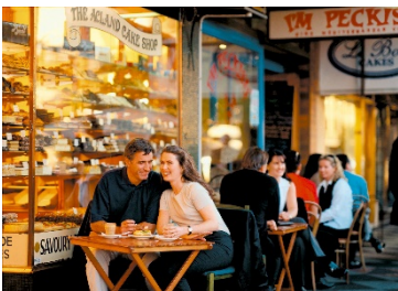
Y 'normal newydd' ar gyfer tafarndai, bwytai a chaffis yn Llangollen?

Mae Llangollen yn gyrchfan o bwys rhyngwladol i dwristiaid ac yn dref farchnad. Mae canol y dref yn profi cyfaint llawer uwch o draffig na llawer o ganol trefi eraill yn Sir Ddinbych am mai dyma'r man cyfarfod ar gyfer tair ffordd A-ffyrdd pwysig: yr A5 (Llundain i Gaerdybi), y A542 (bwllch yr Oernant) a'r A539 (Rhiwabon). Mae'r palmentydd yn Llangollen yn gul ac mae cyfaint y traffig yn golygu y gall cerddwyr a defnyddwyr y ffordd fod mewn gwrthdaro bron yn gyson yn ystod y tymor uchel. Gyda'r gofyniad i sicrhau y gellir cynnal phellterau cymdeithasol, mae'n risg annerbyniol i fynnu bod cerddwyr yn camu i mewn i ffordd A phrysur.