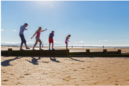
y trysor pennaf yng nghoron y Rhyl: Mae'r traeth yn boblogaidd ond nid yw'n hawdd ei gyrraedd ar droed neu ar feic o ganol y dref

Mae'r Rhyl yn un o drefi glan môr enwocaf Gogledd Cymru ac yn un o'r ychydig drefi yn Sir Ddinbych sy'n elwa ar nifer o strydoedd sydd eisoes yn cael eu pedestreiddio, sy'n