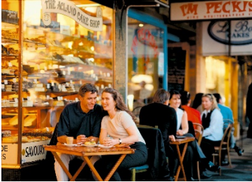
Y 'normal newydd' ar gyfer tafarndai, bwytai a chaffis yn Rhuthun?

yn gyfyngedig gan fod ffyrdd presennol eisoes yn gul ac nid ydynt yn caniatáu i'r palmentydd gael eu lleu tra'n cynnal llif o draffig dwy ffordd.