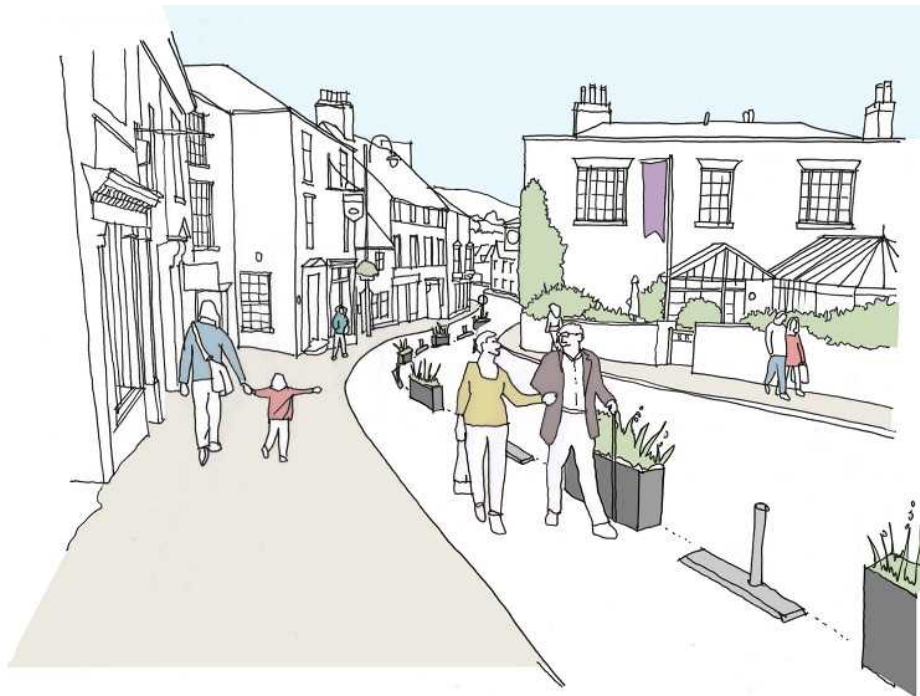
Ffigur 1- darlun o'r cynllun arfaethedig yn Stryd y Ffynnon, a ddarparwyd gan Gyngor Tref Rhuthun