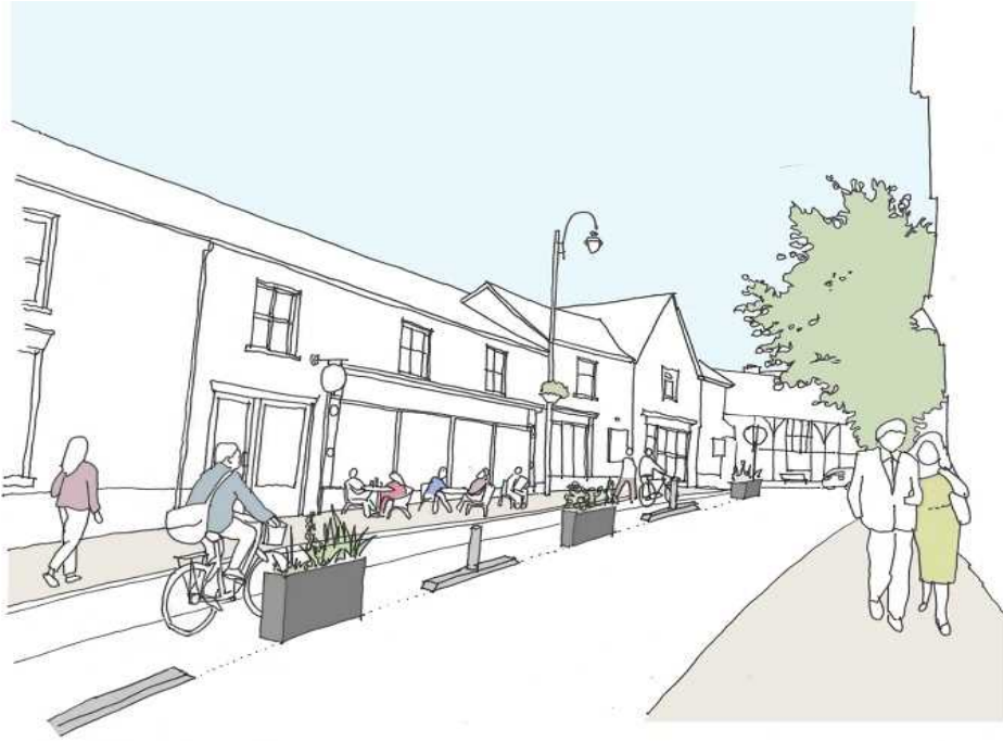
Ffigur 2 - darlun o'r cynllun arfaethedig yn Stryd y Farchnad,