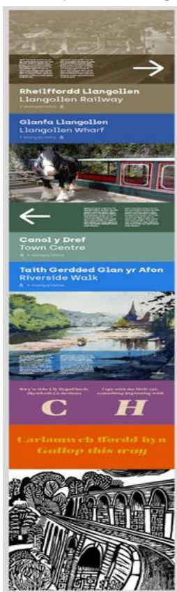
A. Lliw Cryf – Defnyddio lliwiau ac arlliwiau amlwg ynghyd â ffotograffau a gwaith celf lliw llawn

Mae'r dyluniad hwn yn dangos postyn bach, cul. Gellid gosod y rhain mewn mwy o leoedd nag arwyddion mwy, lletach. Gellid eu defnyddio i ddangos hanes ardal, neu i helpu pobl i ddod o hyd i'w ffordd o gwmpas. Byddem yn sicrhau bod yr arwyddion yn defnyddio lliwiau sy'n cyd-fynd â'r ardal y maent yn cael eu gosod ynddi.