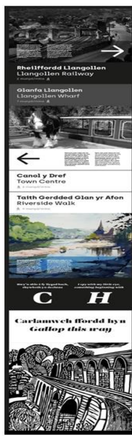
C. Du a gwyn – Defnyddio du a gwyn amlwg gydag arlliwiau llwyd