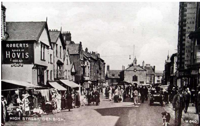
Yn ôl i'r 'hen ddyddiau da'? Gallai marchnad Dinbych ddod o hyd i gartref dros dro ar stryd fawr y dref unwaith eto

Yn unol â'r adborth a dderbyniwyd hyd yn hyn gan fusnesau a thrigolion o gwmpas y Sir, rydym am sicrhau bod canol tref Dinbych yn teimlo'n ddiogel a chroesawgar, ac i sicrhau ein bod yn cefnogi rhai o dafarndai, bwytai a chaffis Dinbych i greu mannau awyr agored diogel i'w cwsmeriaid dreulio amser gyda ffrindiau neu deulu.